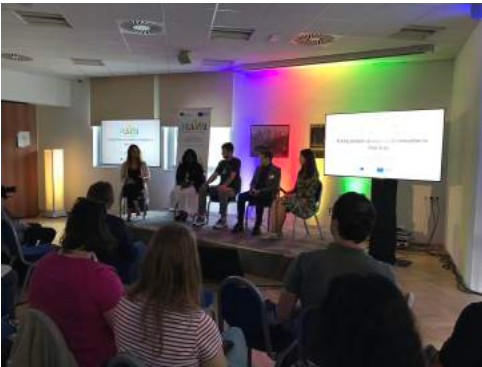
June, 2 nd

Innovare, a mio parere, significa immaginare e osare il nuovo, il non ancora sperimentato. Non si tratta semplicemente di rimodulare, riadattare, vestire con diverse forge e colori strumenti e soprattutto approcci che hanno dimostrato nei fatti di essere superati e, quindi, inefficaci.