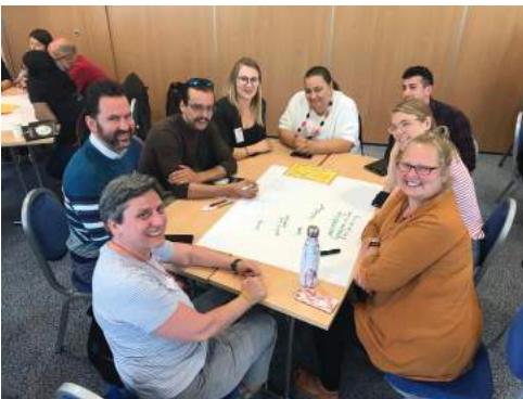
June, 3 rd

Fino a quanto è sopportabile questa postura? I movimenti dal basso, quelli che per agire sulle urgenze e bisogni espressi dalla società non hanno bisogno di certificazioni istituzionalizzanti e riconoscimenti istituzionali, come è nella storia di tutte le esperienze più significative delle cosiddette 'organizzazioni non governative' (la definizione "non governative" ha ancora un senso oggi?) e dei movimenti giovanili più spontanei e coraggiosi (come i "Fridays for Future" e quelli operanti in altre aree del globo, come in Sud America, nel Nord Africa e Asia) ci dicono che il "nuovo" è possibile, ma è altrove dalle kermesse marchiate come ufficiali e ufficializzanti.