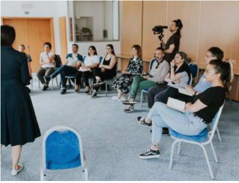
June, 1 st

Sono alcune delle considerazioni personali che ho avuto modo di esprimere durante gli appuntamenti online citati e anche durante le giornate slovene, nei lavori di gruppo soprattutto. Non pochi colleghi e colleghe hanno espresso sintonia con gli interrogativi che mi pongo per me stessa e che pongo in queste occasioni di incontro con altrə impegnatə sullo stesso campo d'azione.