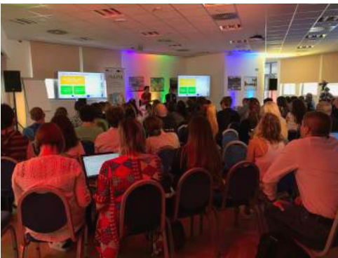
June, 3 rd