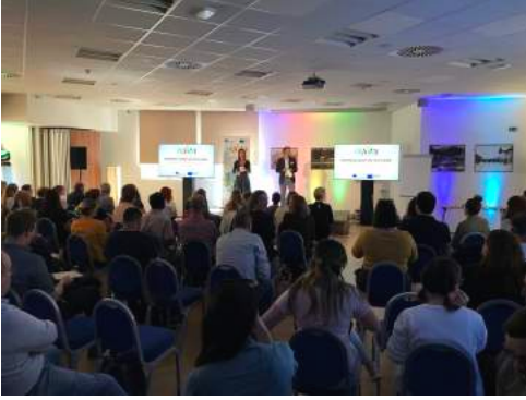
June, 1 st

Ho trovato insufficiente l'impianto della ricerca proposta in apertura e le sue indicazioni centrate sugli strumenti dello Youth Work e sul riconoscimento della figura dello Youth Worker, ma che nulla dicono del contesto in cui strumenti e animatori dovrebbero agire. La sensazione è che ci si affanni acriticamente a chiedere adattamento alle persone e non innovazione del 'sistema' in cui esse vivono.